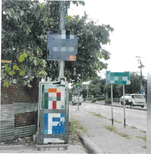
ภาพที่ ๕ บริเวณถนนเลี้ยวเมืองปากเกร็ด จ.นนทบุรี วันที่ ๒๔ สิงหาคม ๒๕๖๐