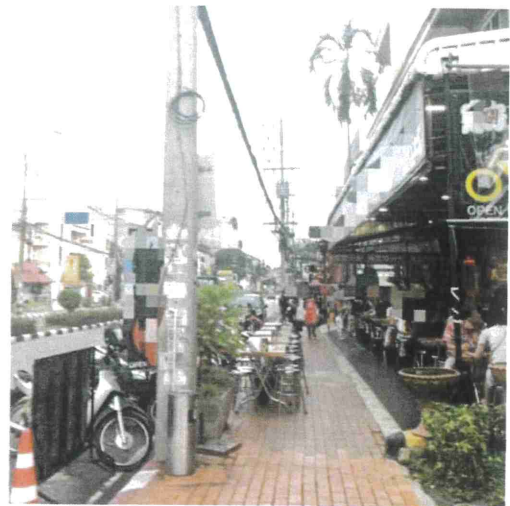
ภาพที่ ๘ บริเวณถนนห้วยแก้ว จ.เชียงใหม่ วันที่ ๒๕ สิงหาคม ๒๕๖๐