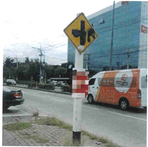
ภาพที่ ๖ บริเวณถนนเลี้ยวเมืองปากเกร็ด จ.นนทบุรี วันที่ ๒๔ สิงหาคม ๒๕๖๐