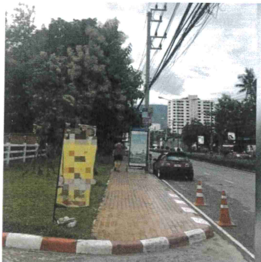
ภาพที่ ๙ บริเวณถนนห้วยแก้ว จ.เชียงใหม่ วันที่ ๒๕ สิงหาคม ๒๕๖๐